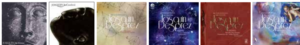
Vol.1 Josquin et Venise